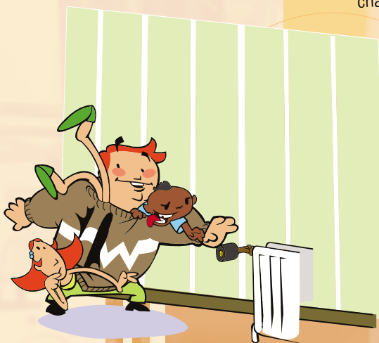
Illustration : Emakina